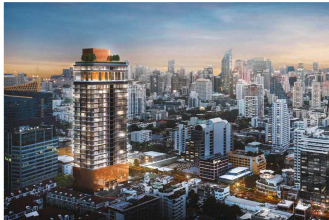
KHUN by YOO 尚思瑞与 YOO 设计工作室合作的第一个品牌公寓