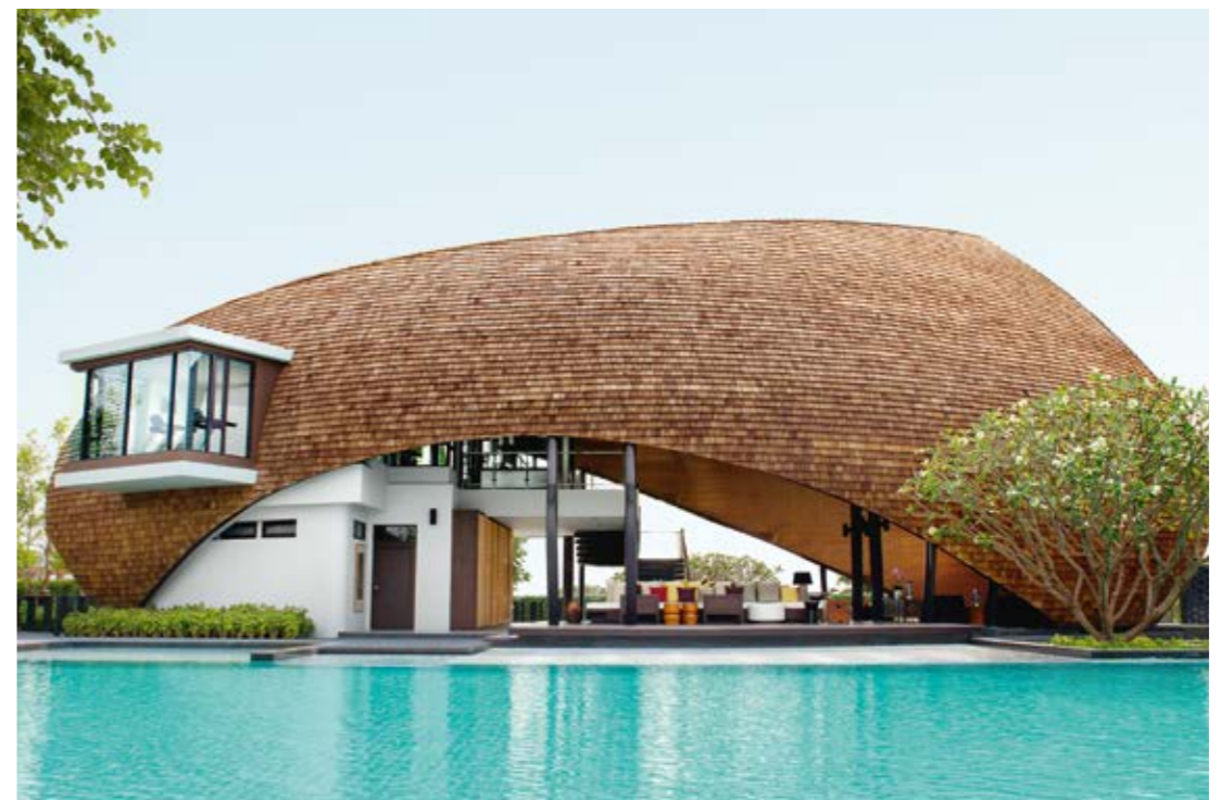
Setthasiri Watcharapol - 现代泰式风格的独立式别墅, 以“全面生活”的概念为特色的泰国公寓, 传达宁静与平和的生活气息。