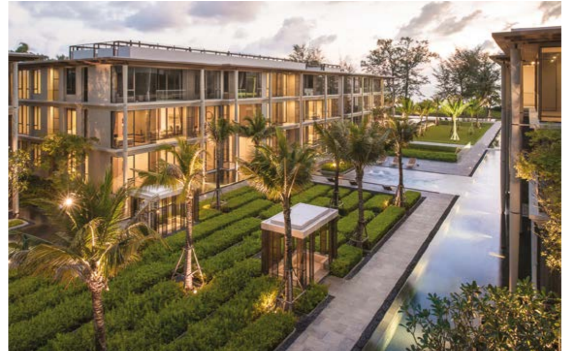
Baan Mai Khao 普吉迈考海滩最美丽舒适的海边公寓之一