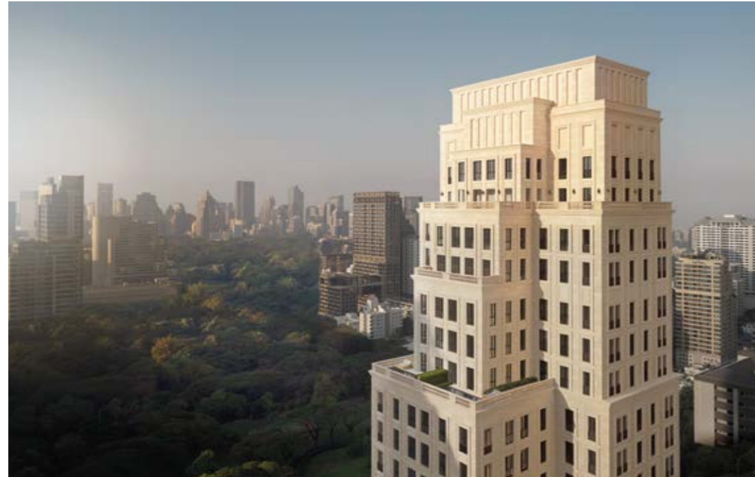
98 Wireless - 以最佳为标准 尚思瑞最新旗舰公寓